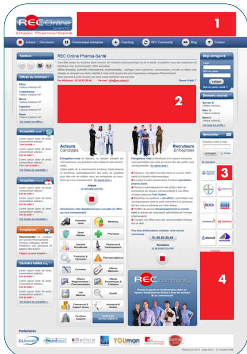
Site HOME PAGE