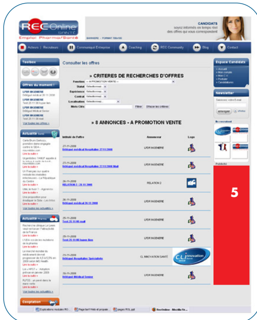
Site page ANNOUNCE