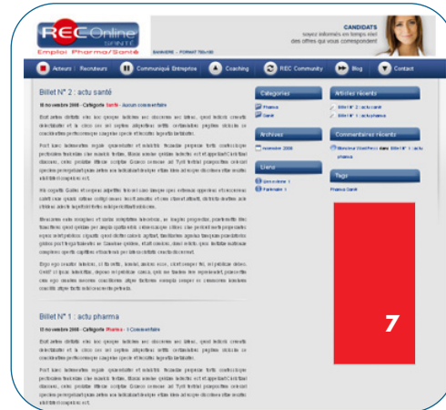
Site page BLOG